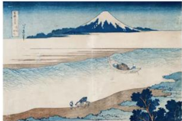
富嶽三十六景 玉川の渡し (日野/柴崎間) 葛飾北斎